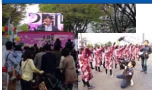
静岡まつり 「夜桜乱舞中継」と「トコチャンステージ」