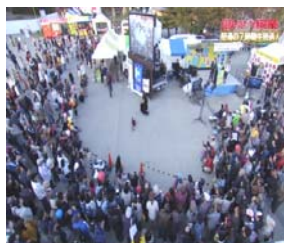
大道芸ワールドカップ