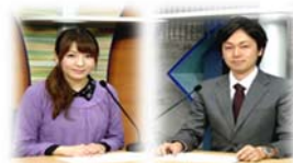
□ デイリーニュース 各地域の催事や季節の便りを、平日は毎日生放送で配信