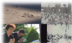
□ ドキュメンタリー 地域の歴史等に焦点を絞った質の高い番組制作