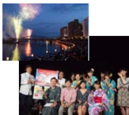
狩野川花火大会