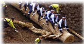
□ 地域の祭典 諏訪大社御柱祭などの各地域の祭典、イベントを長時間生中継で放映