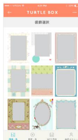
装飾選択画面イメージ