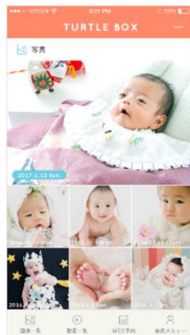
写真メニュー画面イメージ