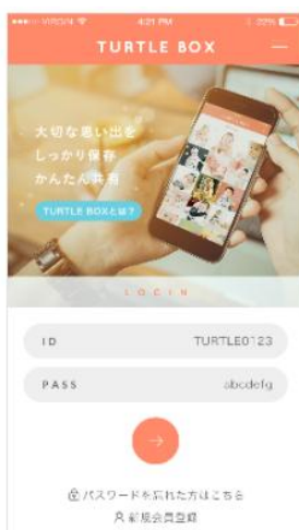
ログイン画面イメージ